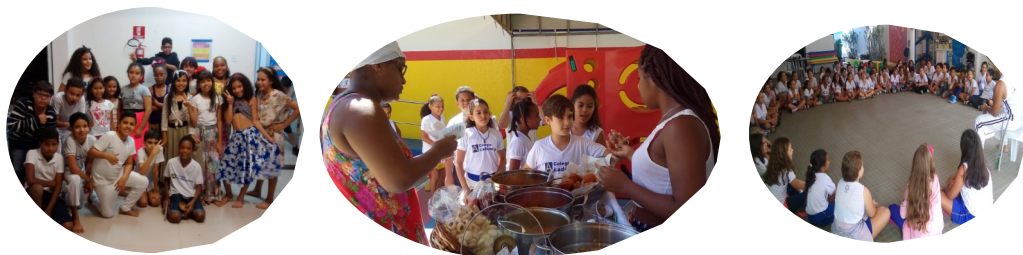
*Confira outras fotos no site e nas redes sociais do Colégio

Entendemos que o folclore é um convite muito especial para imersão à cultura brasileira, por isso, neste dia convidamos a baiana de acarajé, com sua deliciosa iguarias. Tivemos, também, várias apresentações e caracterizações dos alunos da Educação Infantil e Fundamental, cantigas de roda, lendas, sacis, laras e dramatizações. Baianas e capoeiristas não faltaram. Salve o Folclore Brasileiro! Fui um dia maravilhoso! Parabéns, alunos e professores pela grande festa!