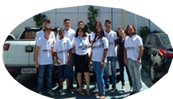
Olimpíadas de Matemática