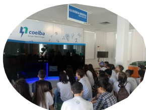
Aula de Campo