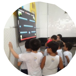
*Confira outras fotos no site e nas redes sociais do Colégio

Os jogos eletrônicos, desde da década de 1980, vem se misturando crescentemente à cultura pop juvenil. Especialistas da pedagogia moderna consideram que os games podem significar mais uma oportunidade de engajamento na educação. É preciso maior aproximação da Escola com a realidade dos jovens. A prática do jogo virtual é também social e precisa ser orientada. O Colégio Acadêmico reconhece que a satisfação é o maior aliado da aprendizagem.