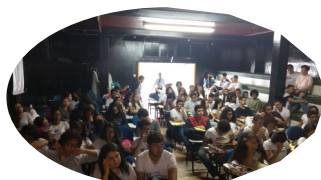
Aulões Interdisciplinares ENEM