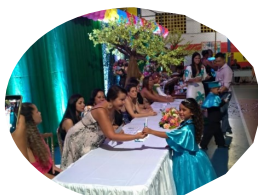
Doutores do ABC