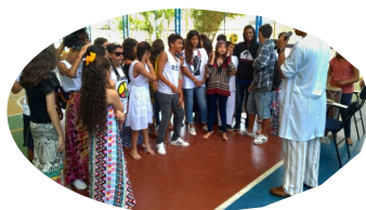
Somos todos um ...