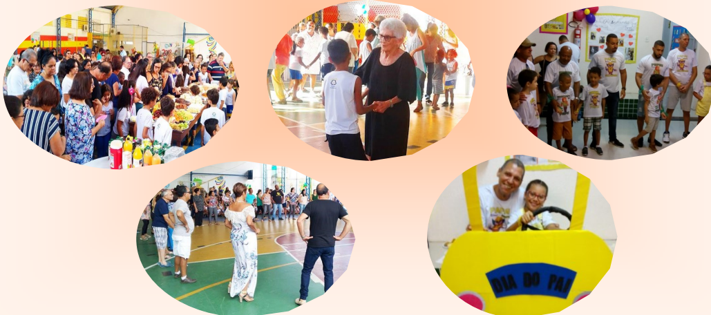
*Confira outras fotos no site e nas redes sociais do Colégio

O ano de 2018, foi a ano da Família no Colégio! Estreitamos ainda mais os laços de amizade e confiança, para isso, desenvolvemos projetos que permitiram a participação efetiva da família. Finalizamos com um delicioso lanche!